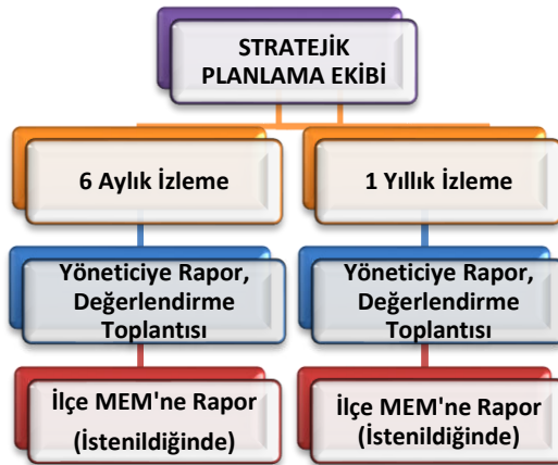
Şekil 8 Stratejik Plan İzleme ve Değerlendirme Modeli

Müdürlüğümüzün 2024-2028 Stratejik Planı İzleme ve Değerlendirme sürecini ifade eden İzleme ve Değerlendirme Modeli hazırlanmıştır. Okulumuzun Stratejik Plan İzleme-Değerlendirme çalışmaları eğitim-öğretim yılı çalışma takvimi de dikkate alınarak 6 aylık ve 1 yıllık sürelerde gerçekleştirilecektir. 6 aylık sürelerde Okul Müdürüne rapor hazırlanacak ve değerlendirme toplantısı düzenlenecektir. İzleme-değerlendirme raporu, istenildiğinde İlçe Millî Eğitim Müdürlüğüne gönderilecektir.